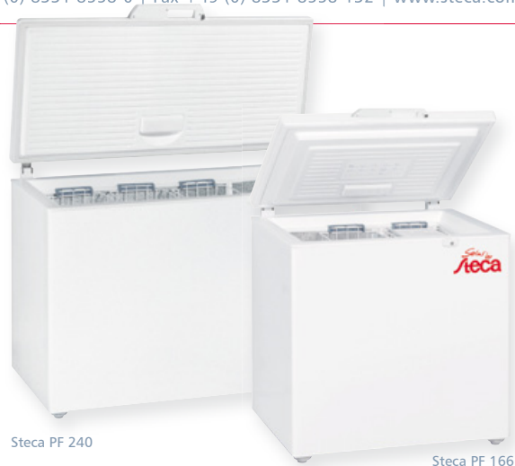
Steca PF 240